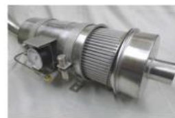
2x ELEMENT tot 80KW